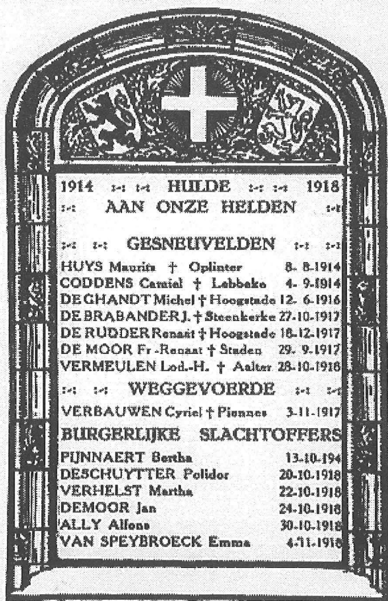
INHULDIGING GEDENKPLAAT LANDEGEM 18-7-1926.